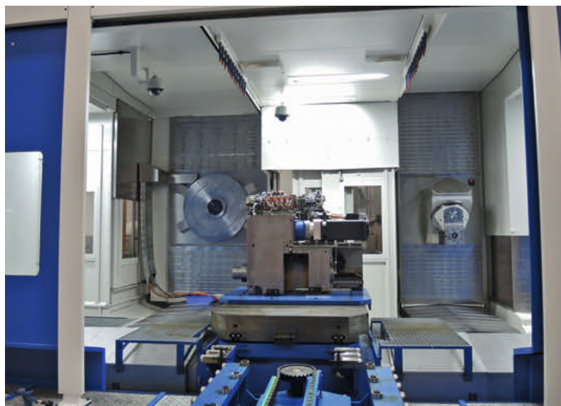
2 Einfahren des Verzahnungskopfes zum Austausch auf C-Achse; links Verzahnungsfrässtation, rechts HV-Spindel