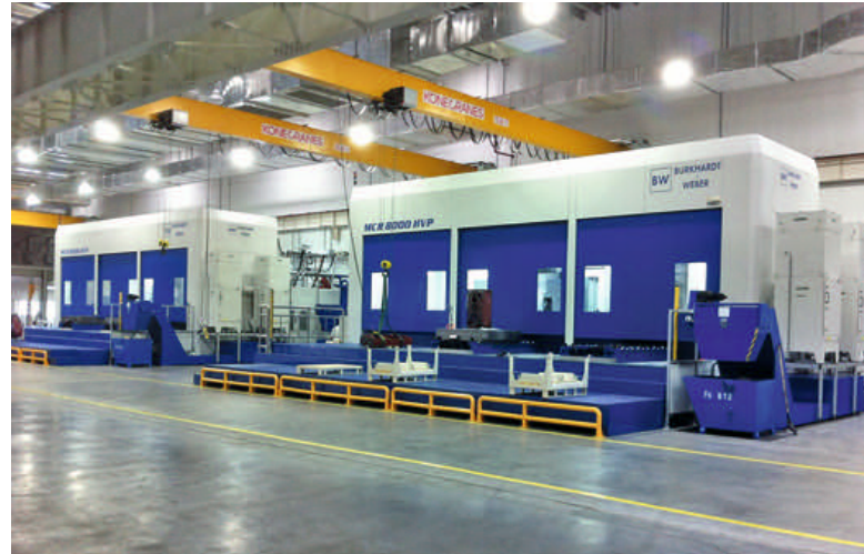
4 Die beiden MCR 8000 HVP im Werk SEW Industrial Gears in Tianjin

Grundidee war schnell geboren: Man nehme ein Standard-BAZ aus der MCX-Baureihe, verlängere die X-Tischachse um fünf Meter, setze eine zweite Frässtation an diese Achse, statt die Frässtation mit einem Mehrachs-Verzahnungskopf aus und adaptiere eine Verzahnungsfräser-Wechselvorrichtung.