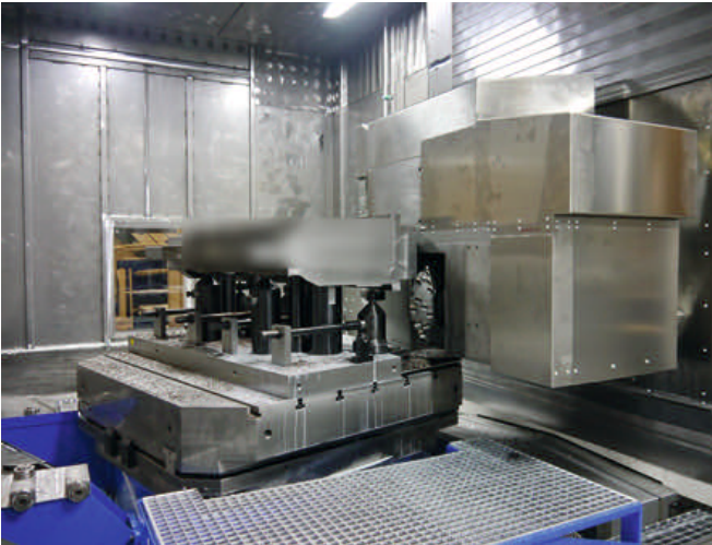
3 Verzahnungskopf mit Fräser Durchmesser 400 mm