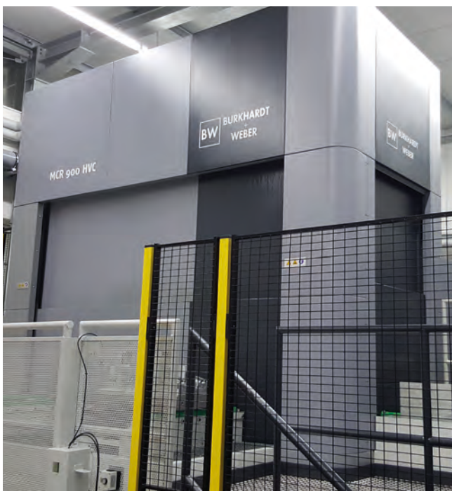
MCR 900 HVC bei Aircraft Philipp in Karlsruhe.

Deutschland nimmt in der internationalen Luft- und Raumfahrtindustrie eine zentrale Rolle ein und die Branche gilt auf Jahre hinaus als Wachstumsmarkt. Basis für diese weltweit starke Marktstellung ist die Technologie- und Innovationsführerschaft in Entwicklung und Produktion, gepaart mit höchster Qualität und Zuverlässigkeit von deutschen Unternehmen – und das nicht nur von großen Konzernen, sondern auch Dank typisch deutschen Mittelständlern, wie Aircraft Philipp und BW. Obwohl das Projekt mit Aircraft Philipp eines der ersten in der jüngeren Geschichte für