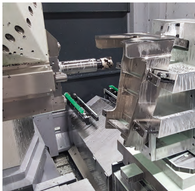
Struktur-Flügelteil für einen Business Jet aus einem Titanschmiedeteil der Firma voestalpine BÖHLER Aerospace GmbH & Co KG.

Zum Jahresende 2017 erfolgte die Lieferung des mit groß dimensionierten Flachführungen ausgestatteten Bearbeitungszentrums, ausgerüstet mit einem Werkzeugmagazin für 128 Werkzeuge sowie einer NC-gesteuerten Getriebspindel mit einem maximalen Drehmoment von 1.400 Nm. Mit den Verfahrwegen von 1.600 mm in X-, 1.250 mm in Y- und 1.800 mm in